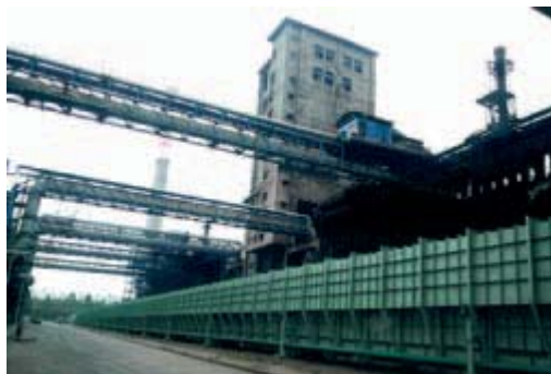
建成機側爐頭煙地面除塵站