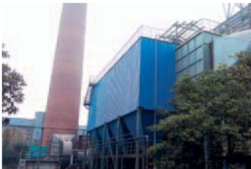
1#燒結機尾除塵提效改造