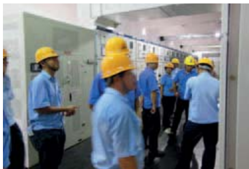
海南礦業 EHS 體系審計

本集團致力於為員工提供安全舒適的工作環境。為對接國際化安全績效指標系統，本集團於2016年9月發佈了《復星集團安全環保特殊標準之職業健康、安全與環保績效指標管理程式》，要求各企業上報所有損工事故和損工事故發生頻率等EHS先導指標，進一步提升和細化了EHS管理。