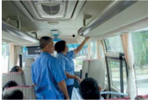
汽車緊急逃生應急演練