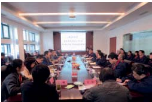
蘇州二葉 EHS 體系審計